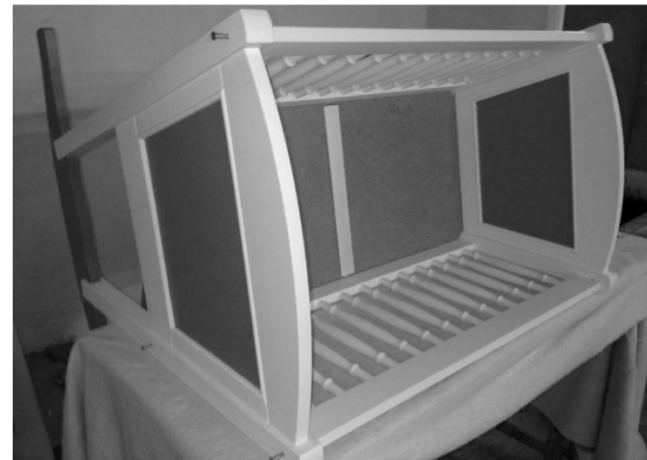
Přišroubování druhého čela k bočnicím

Součástí balení : vrut 70 - 8ks, krytka vrutu - 8ks, 6-ti hranný klíč - 1ks, kolečka - 4ks