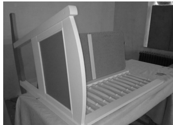
Vložení dna do drážek