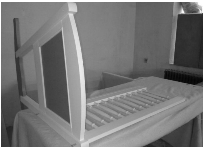
Přišroubování čela s bočnicí